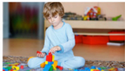
L'importance des couleurs

« La chambre d'un enfant reflète souvent ce qu'il est. L'aménagement influence également ses pensées. Les parents qui souhaitent offrir une pièce rassurante à leur bambin devraient privilégier trois espaces différents : la partie sommeil avec l'emplacement du lit, le coin travail avec un bureau plutôt placé sur un côté et non face au mur, une zone réservée aux jeux avec les différents jouets et tout ce qui permet de créer », détaille Alexandra Viragh. Autres éléments importants : l'orientation et la lumière. Chaque direction cardinale (nord, est, ouest, sud) et semi-cardinale (nord-est, nord-ouest, sud-est, sud-ouest) apporte, selon la spécialiste, « une note psycho-décorative complémentaire à la chambre, influençant l'ambiance, le bien-être et le psychisme de l'enfant ». La distribution des fenêtres, les différentes pièces seront plus ou moins bien exposées à l'ensoleillement. Par exemple, une fenêtre qui se trouve au Nord induit le calme et la maîtrise de soi. Au Sud, cela favorise plutôt l'expansion, la sociabilité, les échanges et l'affirmation de soi. Les parents devraient tenir compte de l'orientation cardinale d'une chambre à coucher lorsqu'ils l'attribuent à un enfant », précise-t-elle.