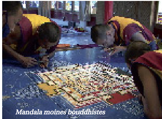
Mandala moines bouddhistes

Réchauffer la pièce en coupant les tons pastel d'un peu de jaune ou de beige sable ; privilégier des serviettes dans des tons chair, épaisses, proches du corps et de la douceur maternelles.