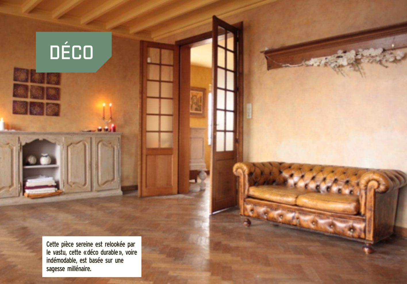
Cette pièce sereine est relookée par le vastu, cette «déco durable», voire indémodable, est basée sur une sagesse millénaire.